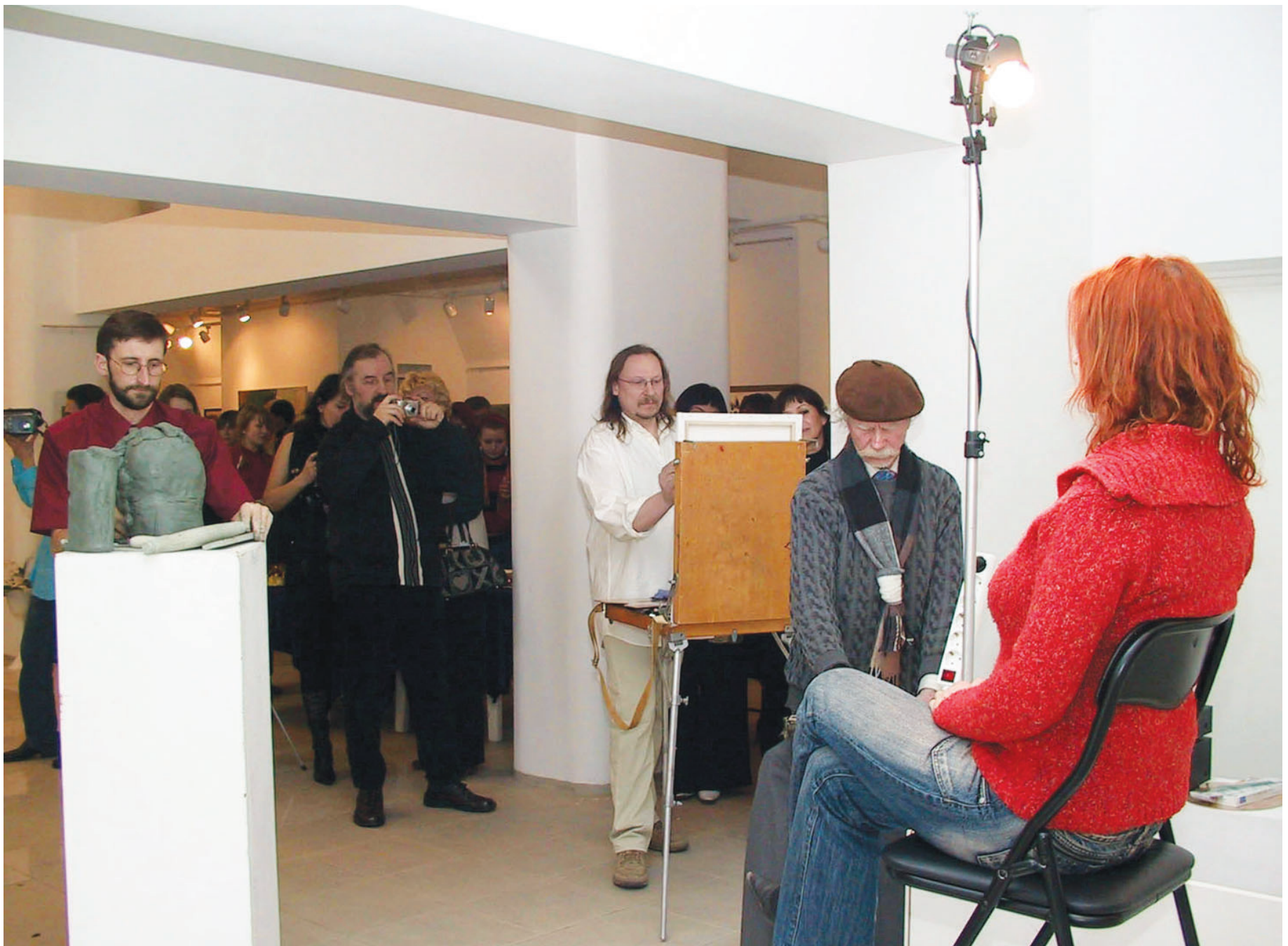
Искусство рождается на глазах публики - кохтла-ярвеские художники нередко устраивают подобные мастер-классы, что всегда вызывает живой интерес посетителей галереи.

Живут кохтла-ярвеские художники дружно и говорят, что у них получается, потому что они не конкурируют между собой, а стремятся к общей цели - поднимать уровень профессионального мастерства. В искусстве ведь потолок не бывает, а все знать невозможно, поэтому всегда найдется чему поучиться. На мастер-классах в качестве учеников можно