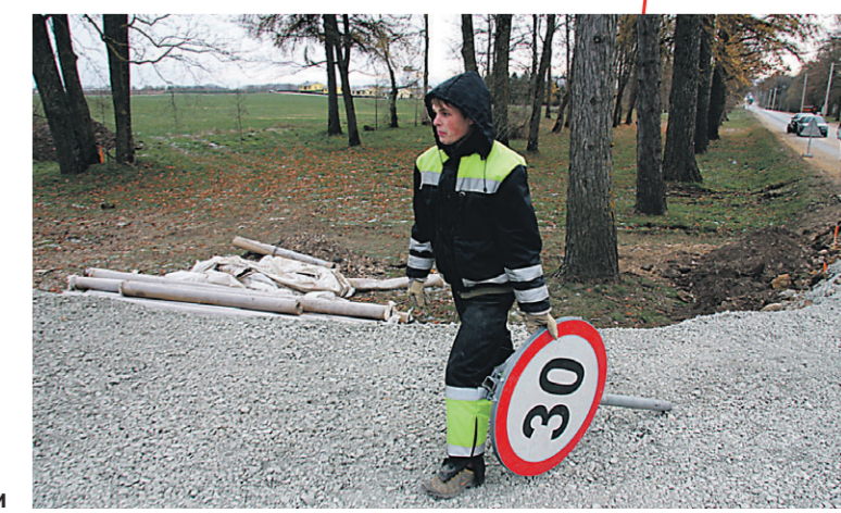
Установка дорожных знаков была вчера одной из главных задач дорожных строителей. 5xПестер ЛИЛЛЕВЯЛИ