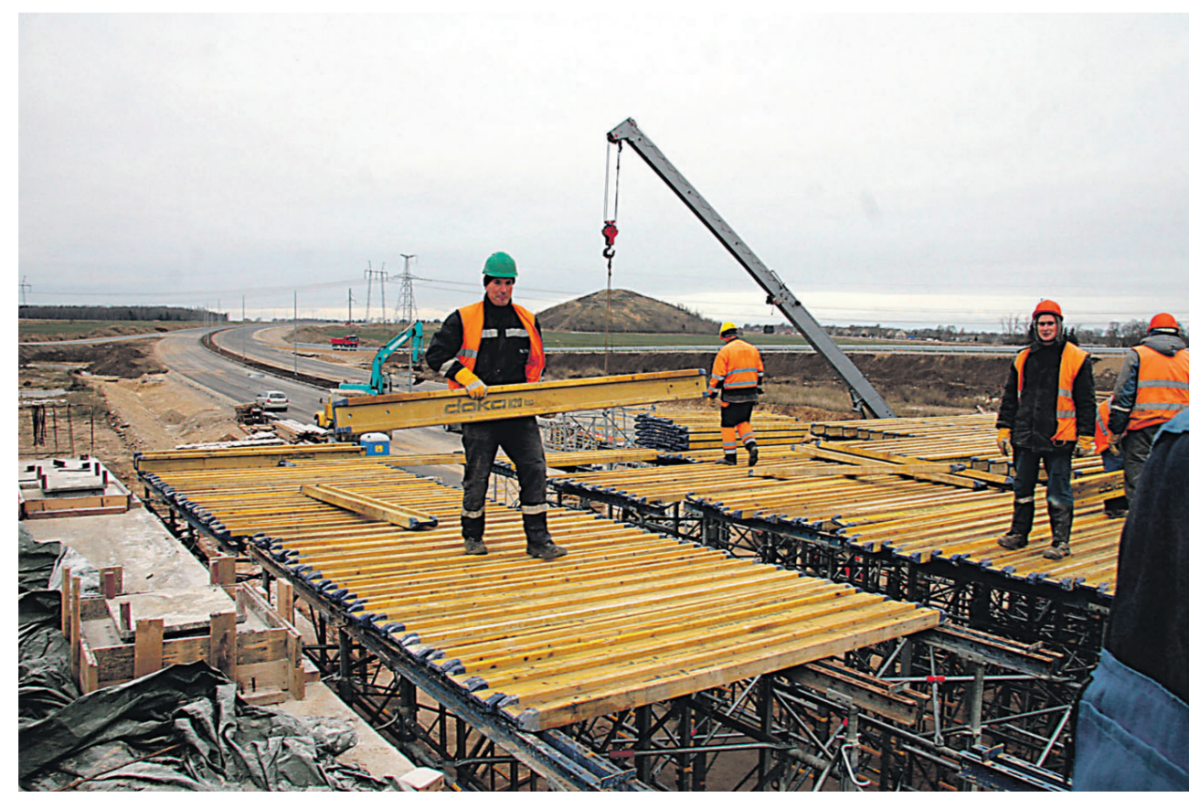
Таммикусский виадук еще не готов, поэтому движение будет направлено поначалу иначе, чем после завершения всего строительства следующей осенью.