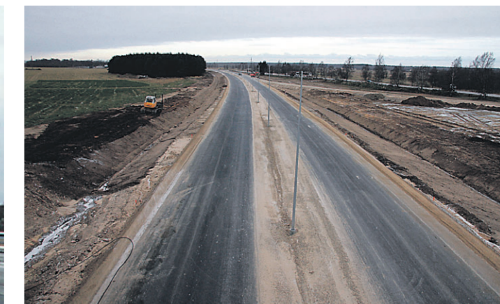
Вид с кукрузеского виадука на дорожный отрезок в таллиннском направлении.