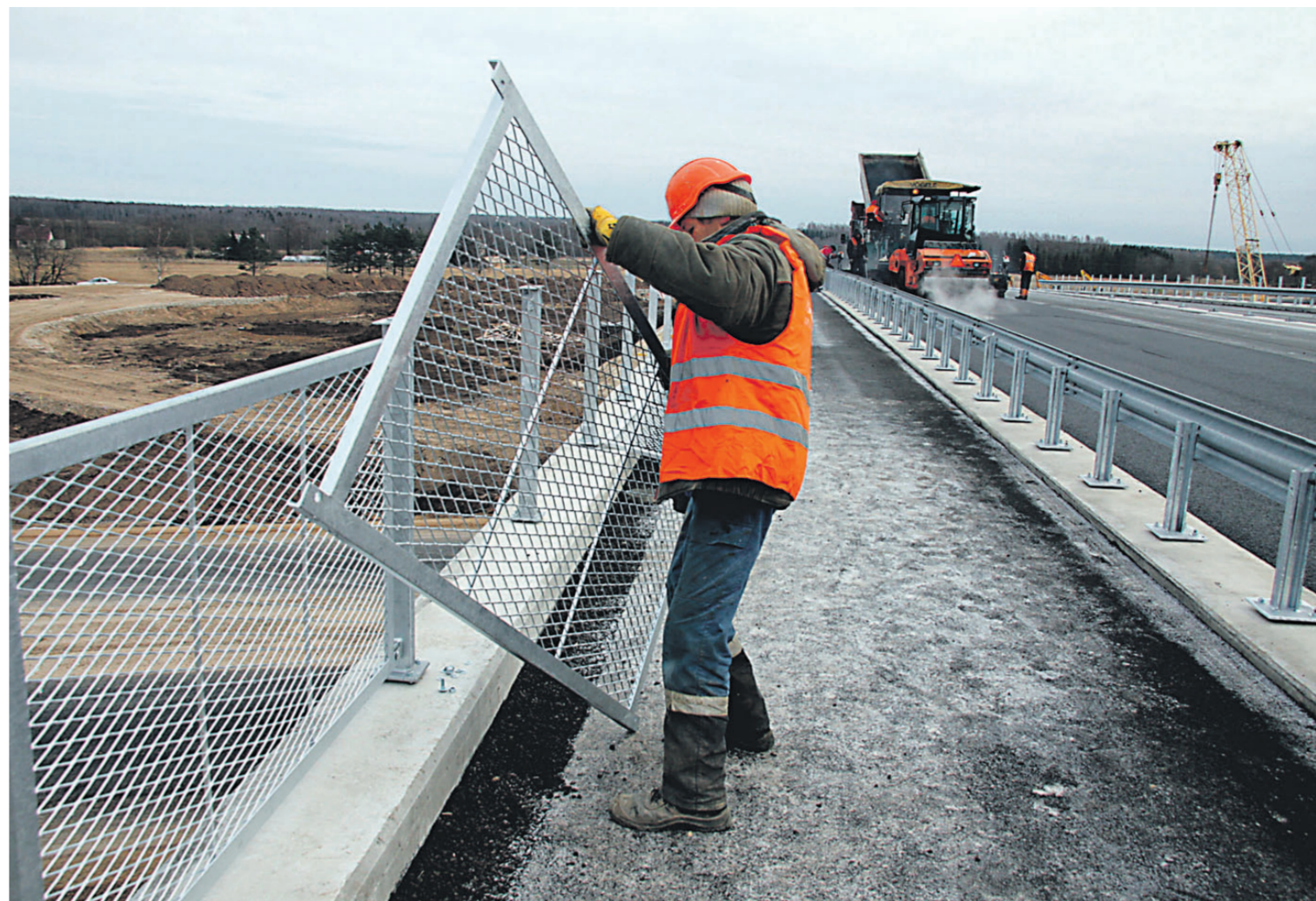
Последние приготовления на кукрузеском виадуке. Еще вчера здесь укладывали асфальт, сегодня здесь ездят автомобили.