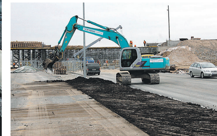
Разделяющий два дорожных направления островок безопасности около таммикусского виадука, находящегося пока в стадии строительства.